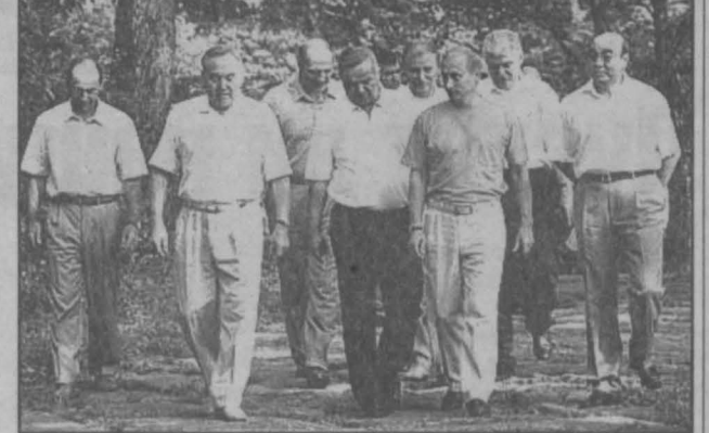
затянули виновники торжества.

На заседании правительства одобрен план приватизации государственного и муниципального имущества на 2002 год. В список вошли 300 предприятий. 40 процентов из списка — предприятия