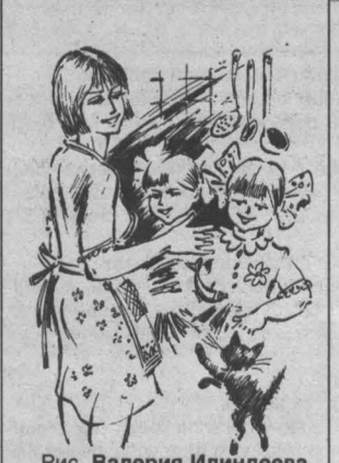
Рис. Валерия Илиндева.

Наташа учится в первом классе. В своей школьной тетради написала «жить». — Ты же знаешь, как пишется «жи-ий», — удивляется мать. — Да знаю, — недоумоно ворчит девочка. — Только кого мы обманываем? Говорим «жи», и писать надо «жи». Не то мяукнул... Пятилетняя Оля со старшей сестрой Светой и котенком Мурзиком играли в «домик». Роли распределили так: Света была «мамой» Мурзика, Оля — его «тетей». По ходу игры они всем семейством «приехали в гости» к своей матери, которая в это время на кухне жарила рыбу. Котенок, учуяв рыбные запахи, подбежал к хозяйке и, ласково потеревшись о ее ноги, неожиданно отчетливо произнес: «Ма-ма». Столь забавное «высказывание» хвостатого любимца развеселило всех, а маленькую Олю, прямо-таки привело в восторг. — Это он нечаянно, — смеется мать, отрезав котенку кусочек рыбы. — Он не так хотел сказать... — Да, он хотел сказать «бабушка», — довольные, поглаживают говорящего котенка дочка.