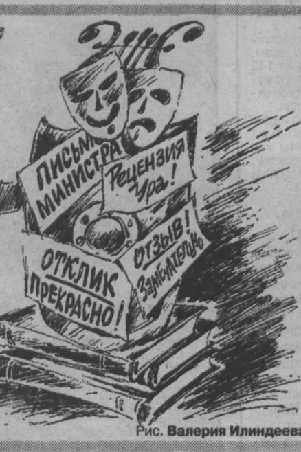
Рис. Валерия Илиндева.

Приведу только некоторые. Скажем, спектакль «Жиронья-Жиронья», НИКОГДА на сцене этого театра не шел. То был телеспектакль, поставленный в павильоне Кемеровской студии телевидения режиссером А. Блекманом. Правда, участвовали в нем в основном артисты Театра оперетты Кузбасса. И пели они под... чужие фонограммы. Никогда не было в репертуаре этого кузбасского театра и спектаклей «Пепи Длинный-чолок» и «Гори, гори, моя звезда». Дело в том, что в...помещении театра оперетты как-то летом гастролировал приезжий Театр юного зрителя. Гастроли и показывали юным кемеровчанам