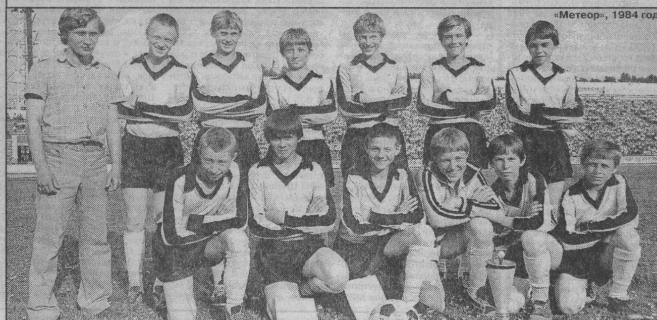
«Метеор», 1984 год.

Открылся первый сезон в детском оздоровительном лагере Главного управления исполнения наказаний. 30 лет он именовался «Державица», с нынешнего года — «Звездный». 225 детей сотрудников уголовно-исполнительной системы и органов внутренних дел области смогут здесь отлично отдохнуть и поправить здоровье.