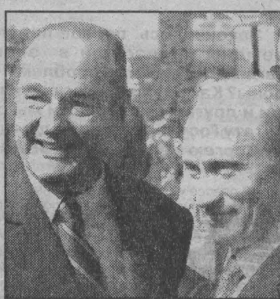
Югославский президент В. Коштуница

Югославский президент В. Коштуница вновь заявил, что не был в курсе решения правительства отправить С. Милошевича в Гаагу, опровергая публикацию газеты «Неделя Телеграф», где приводится часть диалога Коштуница с премьер-министром З. Джинджичем и есть ссылка на некое официальное лицо, подтвердившее подлинность диалога.