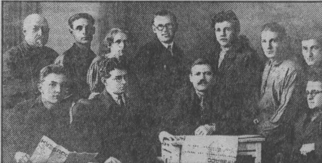
Журналисты газеты «Кузбасс». 1928 г.