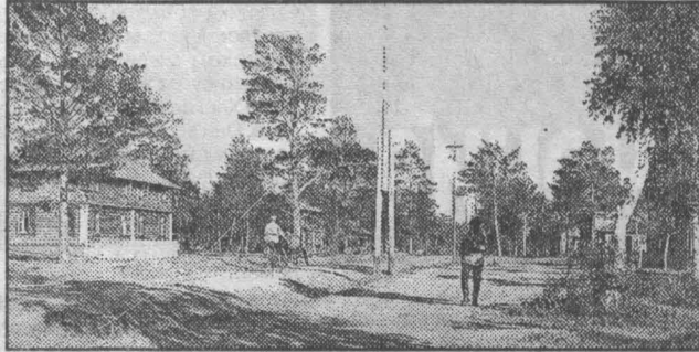
Щегловск, Красная Горка. 1927 г.