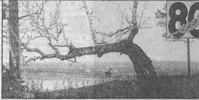
Вид на Щегловск с правого берега Томи. 1927 г.

Таисия ШАТСКАЯ, фотоснимки Владимира Вишнякова представлены его племянником Виктором Вишняковым.