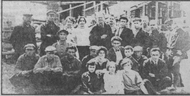
Коллектив «Кузбасса» у строящегося здания редакции. 1927 г.