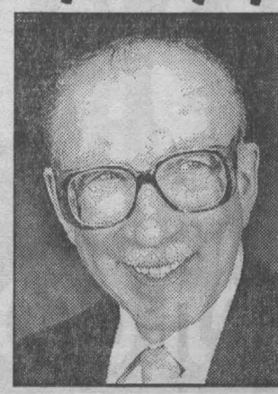
хотел, а отдел-то был сельскохозяйственным.