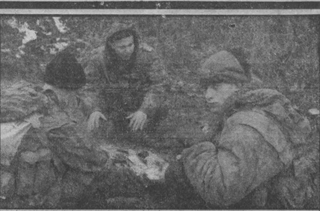
об этом говорят

В эти дни в Кемерове на базе художественного училища проводится региональный семинар «Методические проблемы преподавания на отде-