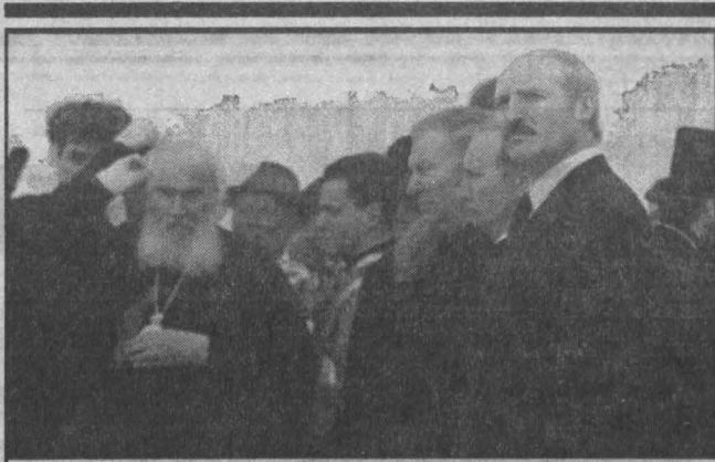
об этом говорят