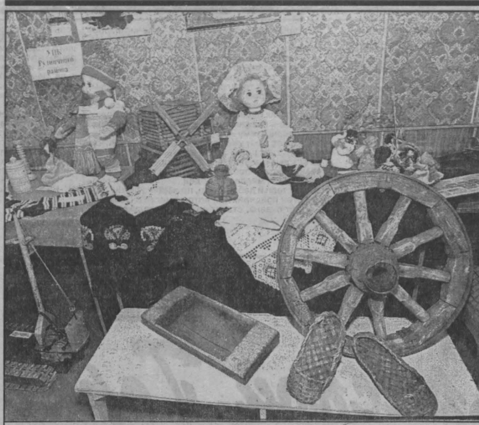
В Доме творчества детей и юношества Рудничного района г. Кемерово проходит выставка декоративно-прикладного искусства. Представлены работы школ района, УПК, кружков Дома творчества. «Новолетие». «На рубеже столетий» и «55-летие Победы над фашистской Германией» — основные темы экспозиции. Многие изделия искусных умельцев как бы возвращают мир русской старине.