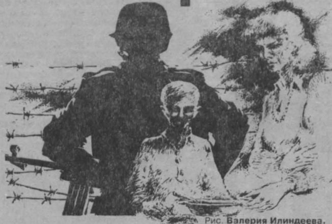
Рис. Валерия Илиндева.

Сегодня, 11 апреля, отмечается Международный день освобождения узников фашистских концлагерей. В преддверии славного юбилея — 55-летия Великой Победы эта дата воспринимается особенно остро. Для миллионов людей, живущих в разных странах планеты, освобождение из гитлеровской неволи стало незабываемым праздником.