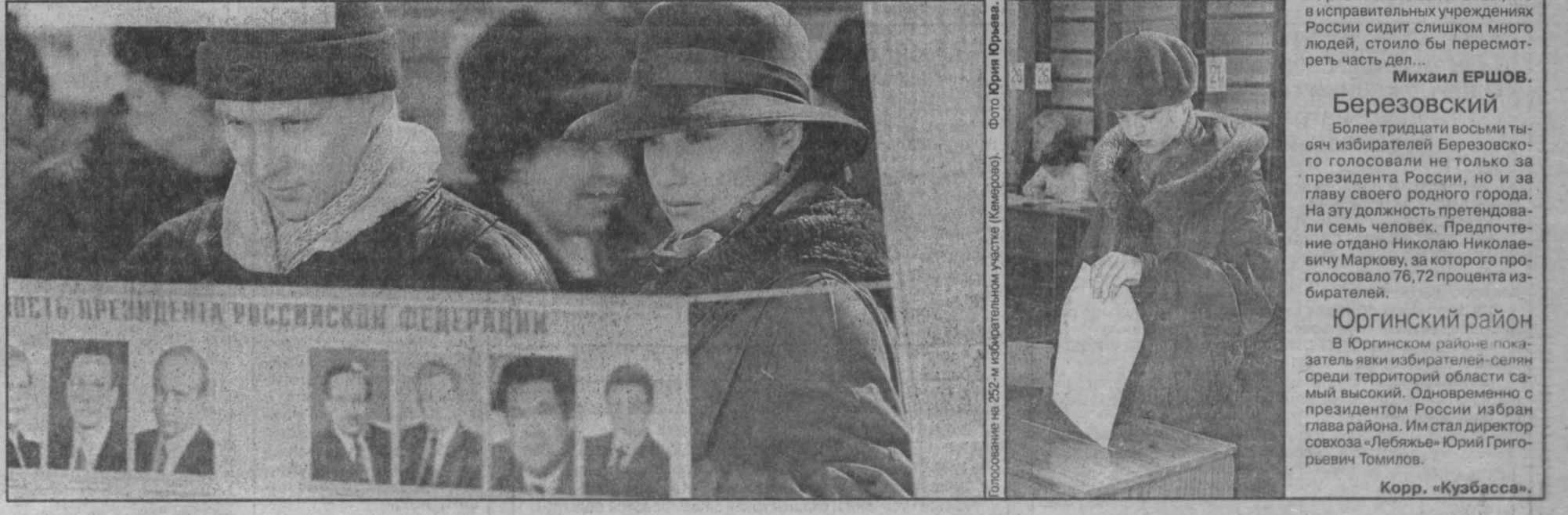
Заполнение № 252-м избирательным участком (Кемерово).

По прогнозу Международной космической метеослужбы, в Кемерово в среду малооблачно, днем до -4, ночью до -10, в четверг ясно, днем до -4, ночью до -10 градусов. По югу области в среду малооблачно, днем до 0, ночью до -8, в четверг ясно, днем -3, ночью до -12 градусов.