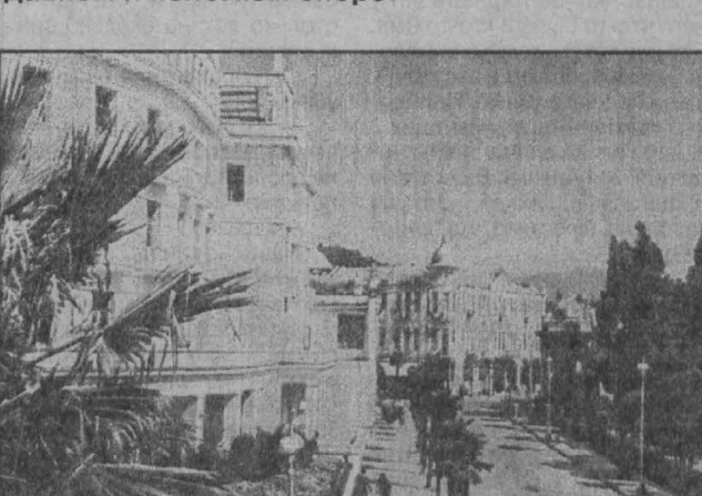
Абхазия. Город Сухуми.

сколь угодно. Абхазии остается искать себе союзников и покровителей за пределами постсоветского пространства.