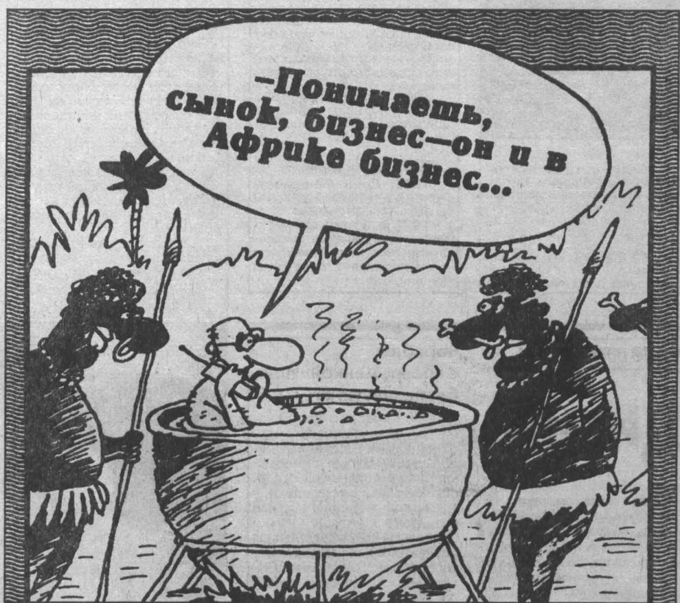
Рис. Вячеслава Шилова.

Мировой опыт свидетельствует, что частная собственность эффективно функционирует только на уровне малого и среднего бизнеса, пока масштабы хозяйства обозримы глазами собственника. В этих условиях частник сам видит, где что лежит и кто чем занимается. Он без всякого механизма хорошо просматривает результаты труда. Поэтому повышение производительности труда посредством частной собственности можно только до тех пор, пока она имеет небольшие масштабы. Но как только частная собственность переходит границу, когда хозяин не в состоянии видеть все, что делается на предприятии, появляется необходимость в экономическом механизме. А если такового нет, эффективность функционирования частной собственности на