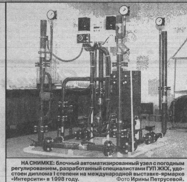
НА СНИМКЕ: блочный автоматизированный узел с погодным регулированием, разработанный специалистами ГПТ ЖКХ.

квартирные счетчики учета тепловой энергии и воды, оборудование для коммунальной энергетики, тепловые узлы с погодным регулированием.