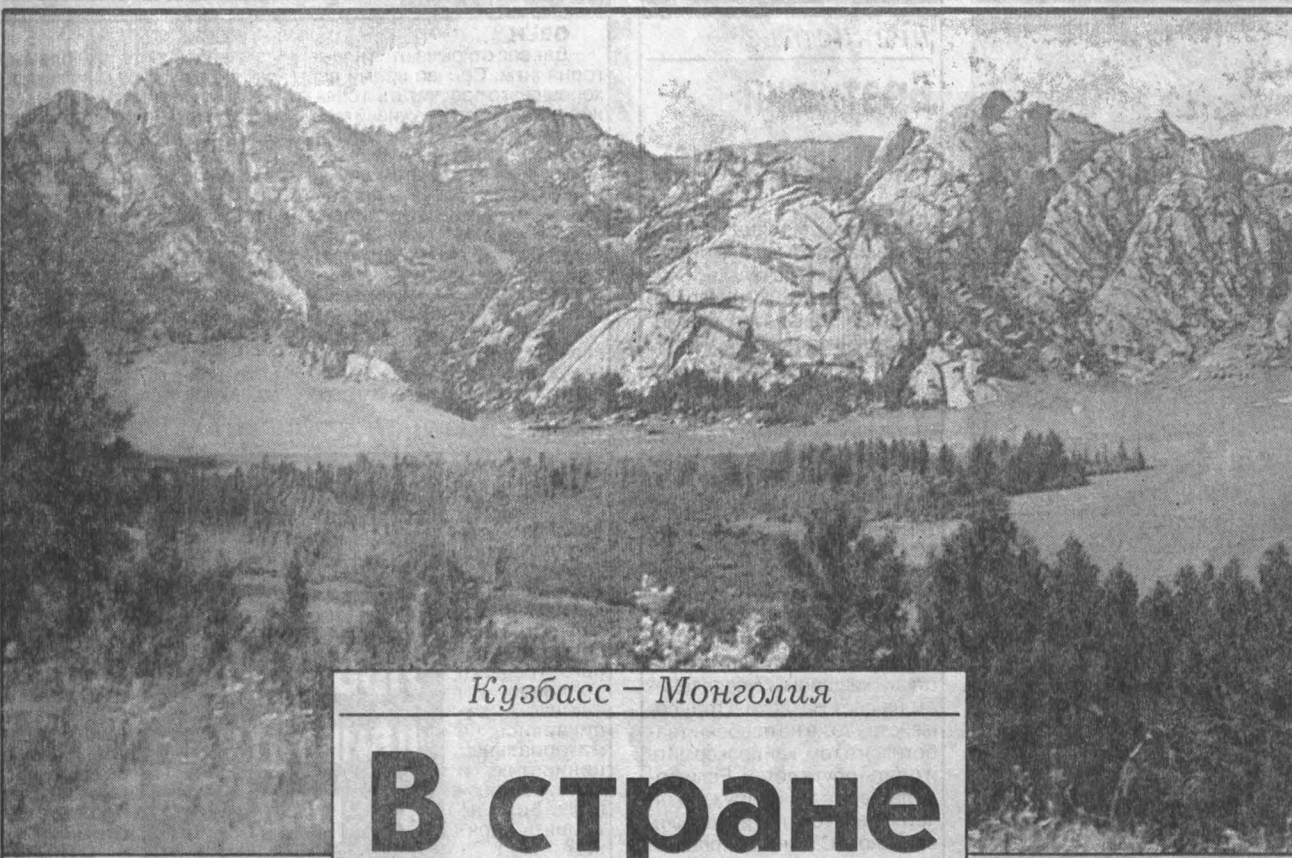
Кузбасс — Монголия