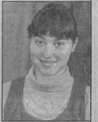
та и администрации Кемеровского района всегда к ней. Не забывает о перспективах саночницы и областной департамент физкультуры, спорта и туризма. Удовольствие-то не из дешевых. Есть деньги — на лед можно выйти в октябре и завершить сезон в мае. Один спуск на искусственной трассе в ледяной Сигулде стоит 12 долларов. Один! В Сигулде хорошая трасса, и многие ведущие саночники мира приезжают туда тренироваться. Хотя и считается трасса не очень скоростной. Скорость, развиваемая спортсменами, до 120 км/час. Есть трассы, где скорость достигает 160 км/час. В России же скорость до 100 км/час.