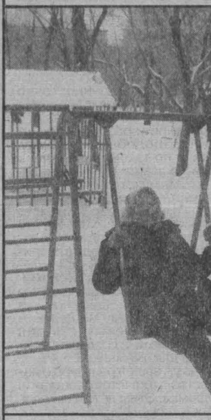
Пока дед ходит за пенсией...