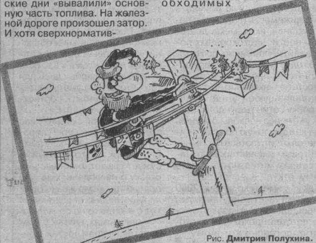
Рис. Дмитрия Полухина.