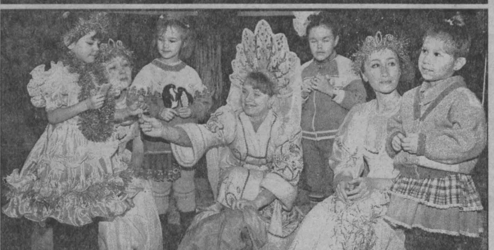
В дни школьных каникул артисты музыкального театра работали без выходных. Новогодний репертуар, который они подготовили для младших школьников, ребята полюбились. Несмотря на сильные морозы детвора пришла на встречу с любимыми сказочными героями, перед спектаклем их ждала новогодняя елка, Дед Мороз со Снегурочкой и конечно же подарки.

экономика не сможет дальше развиваться отдельно от экологии. Вашим выросшим детям в начале этого нового века предстоит платить по вашему долгу, исправлять их — и определять иные, более человеческие пути развития области.