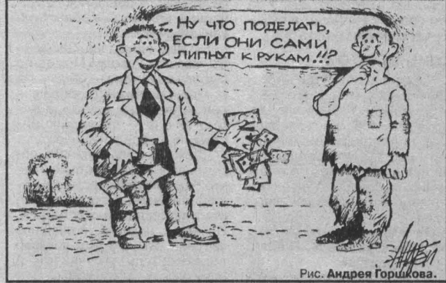
Рис. Андрей Горюнов.