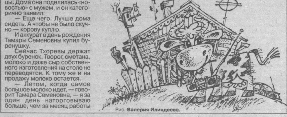
Рис. Валерия Илиндева.

Вот на этот сакраментальный вопрос — за что? — и пообещали ответить в Государственной жилищной инспекции, разобравшись, конечно, на месте в конкретной ситуации, и потом прислать ответ редакции и автору письма. Будем ждать.