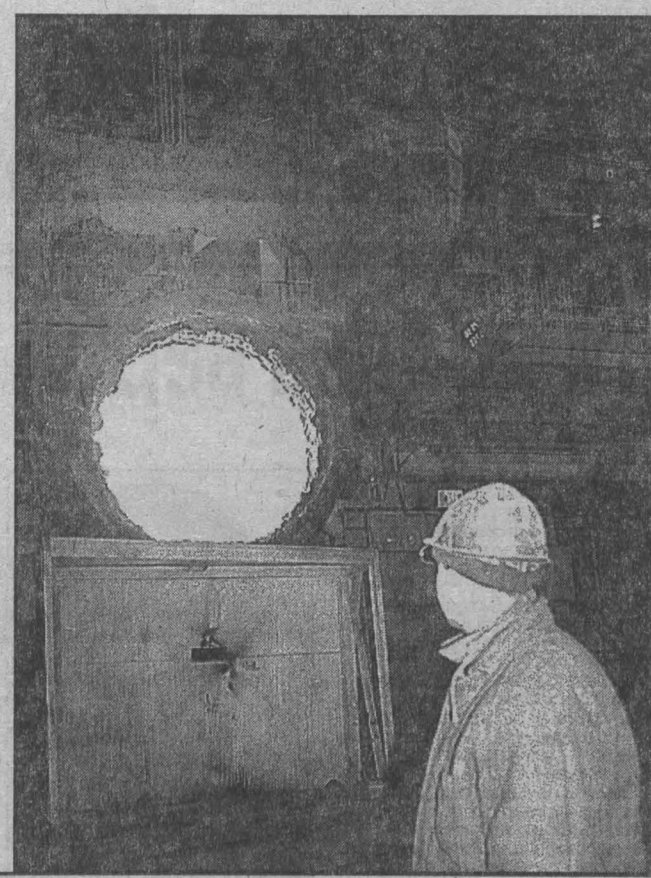
Андрей СНИЦКИЙ. (ИЗВЕСТИЯ). НА СНИМКЕ: в конвертерном цехе Завсба.

К такому же мнению склоняются и российские металлурги. Для обсуждения вопроса о квотах делегация ЕС должна была приехать в Москву. Вылет отложен, был отменен, приезд еврочиновников подтвердили, что «это никак не связано с Чечней». Впрочем, некоторые металлурги считают, что угроза снижения квот наряду с политической имеет и экономическую подоплеку. По их мнению, Евросоюз «обиделся» на введенные Россией экспортные пошлины на металлорез. Разумеется, Россия не подписывалась ставить в Европу дешевой металлургии. Однако понятно, что металлорезом странам