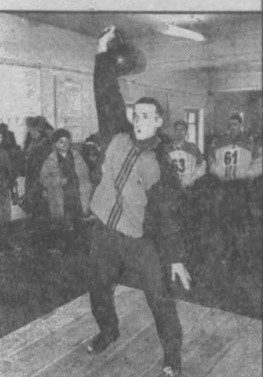
тель в личном зачете получил на память настоящие «командирские» часы.

Командам-победителям были вручены дипломы и переходящие кубки. А каждый победи-