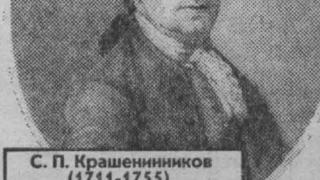
С. П. Крашенинников (1711-1755).

Миллер звание профессора Петербургской академии наук получил в 1731-м, имея от роду 29 лет, Гмелин был моложе его на четыре года, доктором медицины стал в 1730-м. Участие в сибирской экспедиции дало им возможность создать труды, бессмертные их имена.