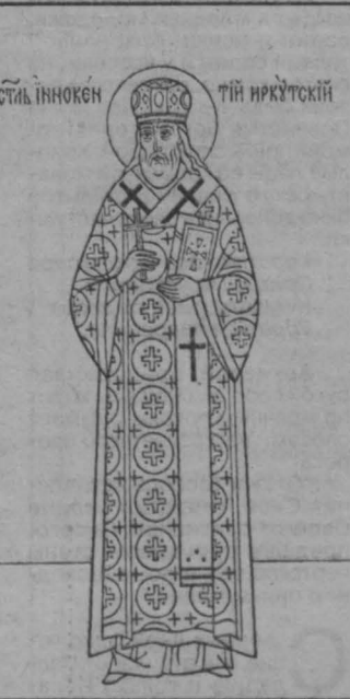
Св. Иннокентий Иркутский.

26 августа 1727 года состоялось два события — в Иркутске была образована епархия (до этого церковь иркутская принадлежала только викариатством Тобольской митрополии), управление которой поручалось Иннокентию, преосвященному епископу Иркутскому и Нерчин-