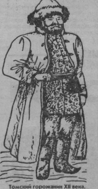
Томский горожанин XVII века.

Сибирская экспедиция, называюте еще Второй Камчатской, снаряженная в 1733 году, была составной частью великой Сибирско-Тихоокеанской экспедиции, начатой Петром I. Его инструкция от 5 февраля 1725 г. данная капитану-командору Витусу Берингу, положила начало грандиозному по своим масштабам, задачам и результатам 20-летию государственному предприятию по освоению водных путей соединения Азии и Америки и научному изучению Сибири. Задачей академического отряда, организованного сенатом совместно с Российской академией наук, ставилось исследование и описание малоизученных восточных территорий, в том числе и южных, куда входил Кузбасс. Возглавлял отряд астроном Ж. Н. Делиль, историк и географ Г. Ф. Миллер и натуралист И. Г. Гмелин. Из них только 52-летний французский астроном Делиль был известен в научном мире, двум последним еще предстояло заявить о себе.