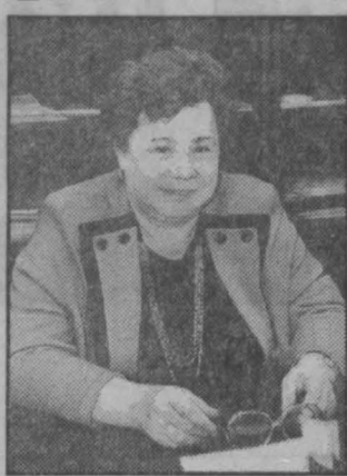
— Более четко установлен порядок создания и регистрации избирательных блоков, выдвижения кандидата избирателями. Хотя недоработки еще есть (они заложены на федеральном уровне). Например, в стороне остаются трудовые

— Какова непосредственная практическая польза новшества? — Более четко установлен порядок создания и регистрации избирательных блоков, выдвижения кандидата избирателями. Хотя недоработки еще есть (они заложены на федеральном уровне). Например, в стороне остаются трудовые