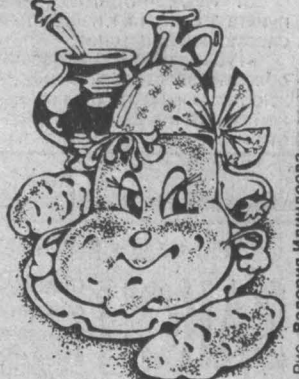
Рис. Валерия Илларинова.

Взять 3 средних баклажана целиком, 3 сладких болгарских перца, освободить от семян, но не резать. 3 красных плотных средних помидора, 3 средних речных лукавицы. Все помыть, положить в кастрюлю и залить трубочки толщной с мизинец, опустить в бульон или суп и варить, пока не поднимется лапша на поверхность. Вкусно!