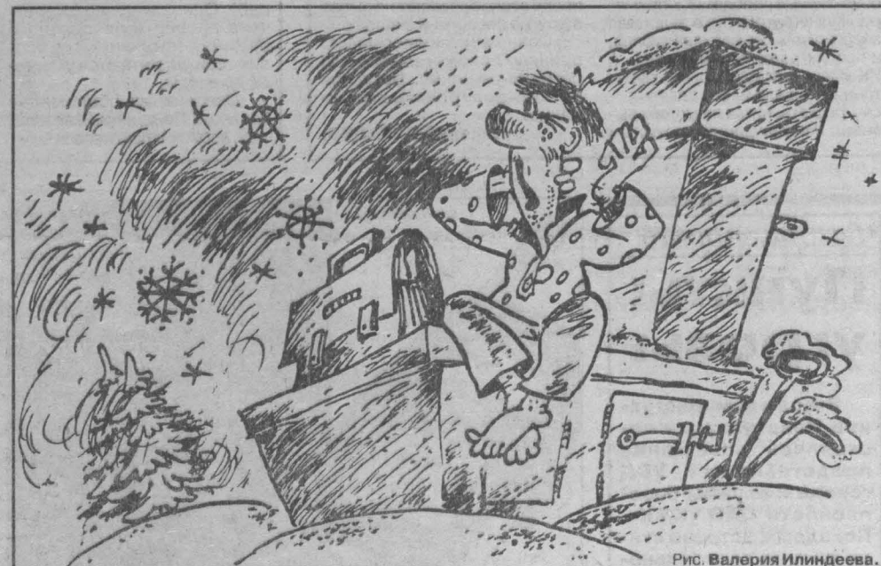
Рис. Валерия Илиндеева.

Жалобы людей, посыпавшиеся со всех сторон, заставили призвать ответственность чиновников. В самом деле деле уголь столь плох? То, что в последние время идет вымывание сортового угля для населения, понятно всем. Стоимость его высока, и в бюджете нет на это средств. Но если раньше «сорт» поступал хотя бы