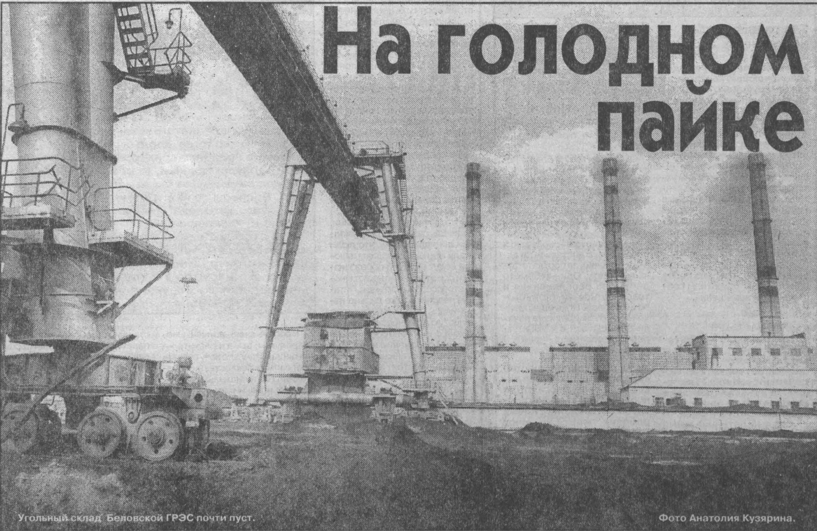
Угольный склад Беловской ГРЭС почти пуст.

Стоимость одного пакета молока за счет более дешевой упаковки составит теперь 6 рублей 50 копеек за литр. Этот вид продукции разработан комбинатом для поддержки социально незащищенных слоев населения. Мощность линии рассчитана на 6-7 тонн молока в сутки.