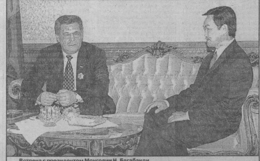
Встреча с президентом Монголии Н.Багабанди.

По приглашению Правительства Монголии 19-21 октября 2000 г. состоялся официальный визит в Монголию делегации Кемеровской области РФ во главе с губернатором, членом Совета Федерации Федерального собрания РФ А.М.Тулеевым. В состав российской делегации входила большая группа представителей промышленных предприятий, высшей школы, работников культуры, социального обеспечения и здравоохранения.