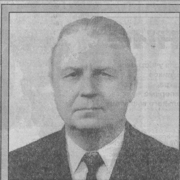
Его знала вся страна: первый секретарь Томского обкома КПСС, многое сделавший для развития своего региона, затем — второй человек ЦК КПСС, а значит, и в Советском Союзе. Сейчас — депутат Государственной Думы, избранный по одномандатному округу.

— Тогда как вам видится сегодняшняя «система», эффекативна ли она?