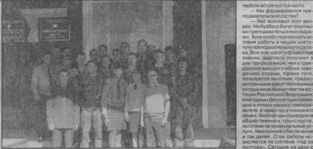
гербом встречаются часто. Как формировался преподавательский состав? Нас волновал этот вопрос. Но Кузбасс богат опытными преподавательскими кадрами. Хочу особо подчеркнуть условия работы в нашем институте преподавательского состава. Все они носят офицерское звание, зарплату получают в два-три раза выше, чем в гражданских учебных заведениях страны. Кроме того, пользуются льготами, предусмотренными для аттестованных сотрудников Министерства юстиции Российской Федерации: ежегодным бесплатным проездом в отпуск самого преподавателя, а через год и членов его семьи, бесплатным проездом в общественном транспорте, льготами на коммунальные услуги, пенсионное обеспечение и так далее. Стаж работы исчисляется по системе «год за полтора». Сегодня из двух с лишним сотен желающих работать в институте по конкурсу приняты двадцать пять преподавателей юридического и социально-гуманитарного направлений. Среди них офицеры внутренней службы: полковник Е. Кызыншаев, подполковник Е. Плотов, подполковник Е. Ефремов, майор А. Чириков, капитан И. Макаров, старший лейтенант И. Дорохов, молодые преподаватели из гражданских вузов П. Климов, Е. Казанцева, И. Чеканникова, Е. Шлинева, Т. Ивашкевич, Е. Новоселова.

басский филиал Владимирского юридического института Министерства юстиции Российской Федерации - дело общее и нужное.