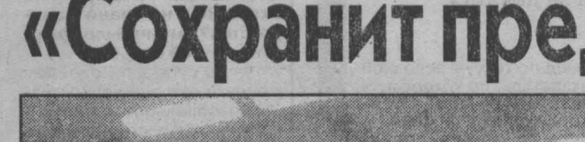
басский филиал Владимирского юридического института Министерства юстиции Российской Федерации - дело общее и нужное.