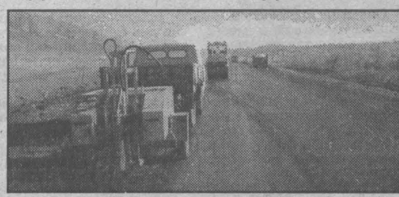
Отбор проб асфальтобетона.

Общество с ограниченной ответственностью «Кузбасский центр дорожных исследований» (КузЦДИ) создано в ноябре 1992 г. по инициативе дирекции областного дорожного фонда администрации Кемеровской области для обеспечения инновационной деятельности и контроля качества работ в дорожном хозяйстве Кузбасса. В настоящее время контроль качества работ и продукции — основной вид деятельности.