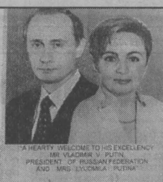
A hearty welcome to his excellency Mr. Vladimir V. Putin, President of Russian Federation and Mrs. Lyudmila V. Putina

Кажется, израильская и палестинская стороны пришли к соглашению, позволяющему прекратить кровопролитие в Иерусалиме. Впрочем, ибо в последние дни президент Ирана Хатами в радиопрограмме заявил: единственным способом урегулировать ближневосточный кризис является уничтожение Израиля.