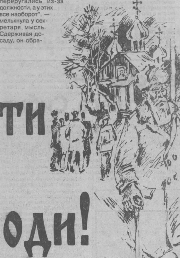
Рис. Валерия Илиндева.