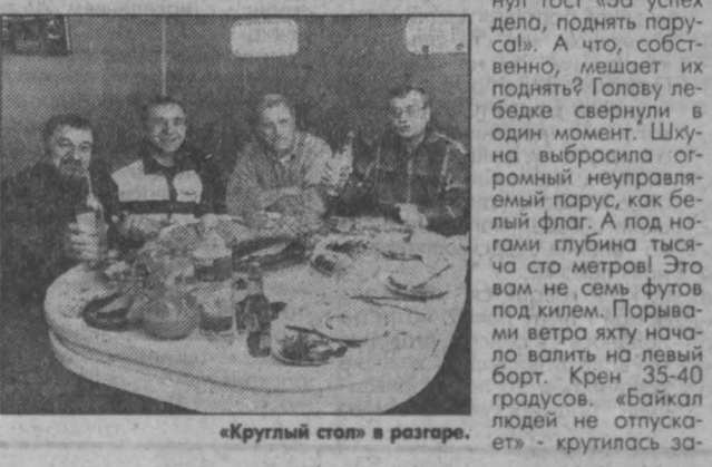
«Круглый стол» в разгаре.