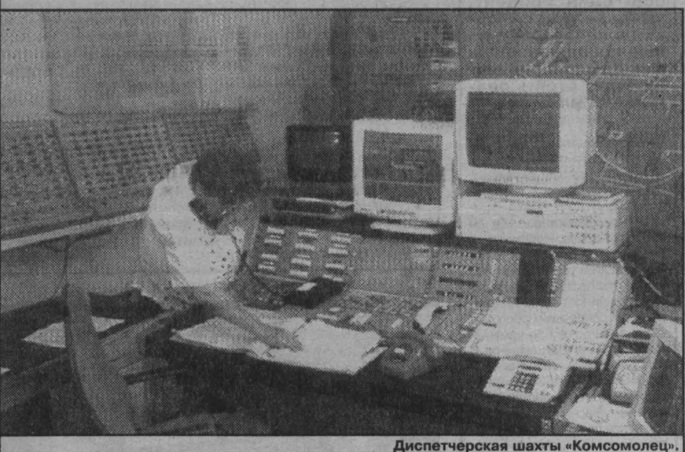
Диспетчерская шахты «Комсомолец».