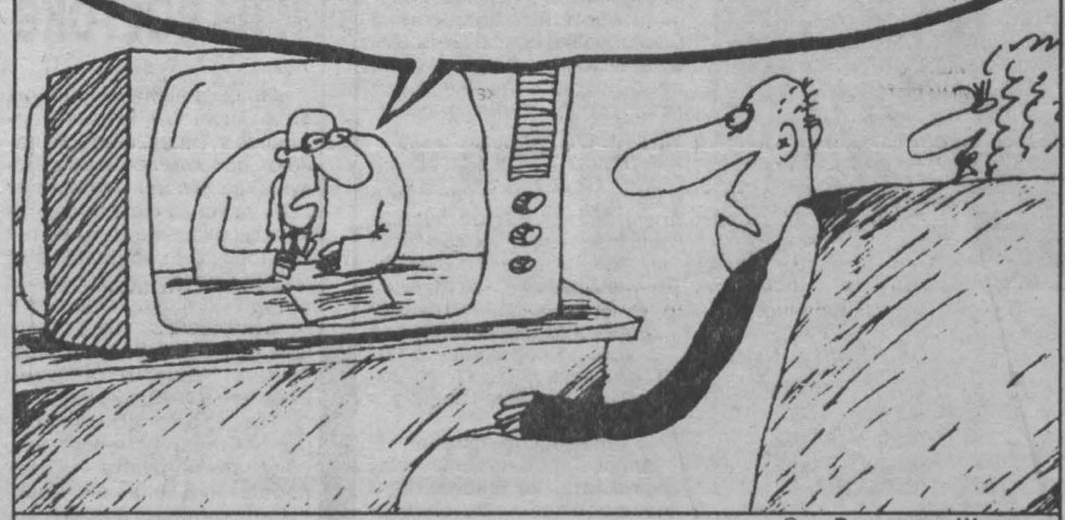
Рис. Вячеслава Шилова.