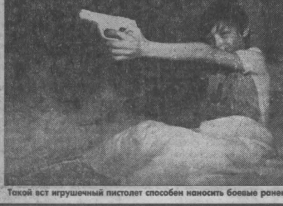
Такой вот игрушечный пистолет способен наносить боевые ранения.

Газета «Уолл-стрит джорнал» США стала крупнейшим рынком сбыта автомобилей «Урал», уступая только самой России, где они производятся в прошлом году в Штатах было продано более тысячи таких машин, причем каждый «Урал» с колесной стоимостью 8 тыс. долларов.