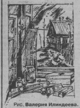
Рис. Валерия Илиндеева.

Татьяна БЕРГ. Пригородный, Кемеровский р-н.