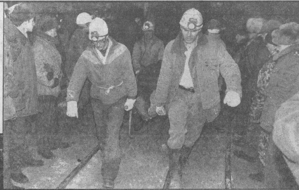
Трагедия на «Зырянской».