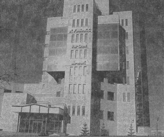
Фото Анатолия Кузьярина.

Областная власть не оставляет людей наедине с банком-банкротом