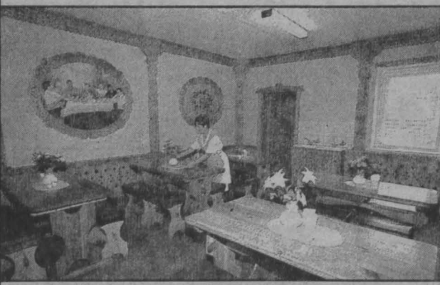
В столовой предприятия.

Власти областного центра отметили четкую и качественную работу ПАТП-4 и выделили деньги на его развитие и подготовку к зиме. И действительно, предприятию есть чем похвастаться.