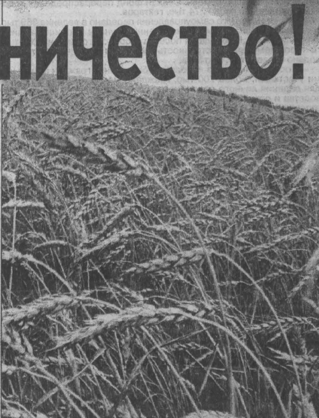
НА СНИМКАХ: соседям — уголь, в Кузбасс — зерно.

ницы сортового помела, режущие части к сельскохозяйственной технике, запчасти к зерноуборочным комбайнам. Новосибирцы в обмен на поставленную продукцию предлагают продовольственные и потребительские товары, промышленную продукцию и строительные материалы. Традиционно Кемеровская область заинтересована в поставках сельскохозяйственной продукции: продовольственного и фуражного зерна, которого уже в этом году мы могли бы закупить соответственно 100 и 50 тысяч тонн, и продукции животноводства.