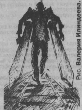
Рис. Валерия Ильинцева.

В ходе оперативно-разыскных мероприятий из незаконного оборота изъято 17 единиц оружия, 105 единиц боеприпасов к огнестрельному оружию. Зарегистрировано одно убийство (преступник арестован), 17 грабежей, два разбойных нападения, четыре хищения грузов с подвижного состава, 15 краж. Всего на объектах транспорта пресечено 60 148 правонарушений, выявлено 2910 мелких хулиганств. Задержано 84 человека, находясь в розыске. Привлечены к уголовной ответственности 1022 человека.