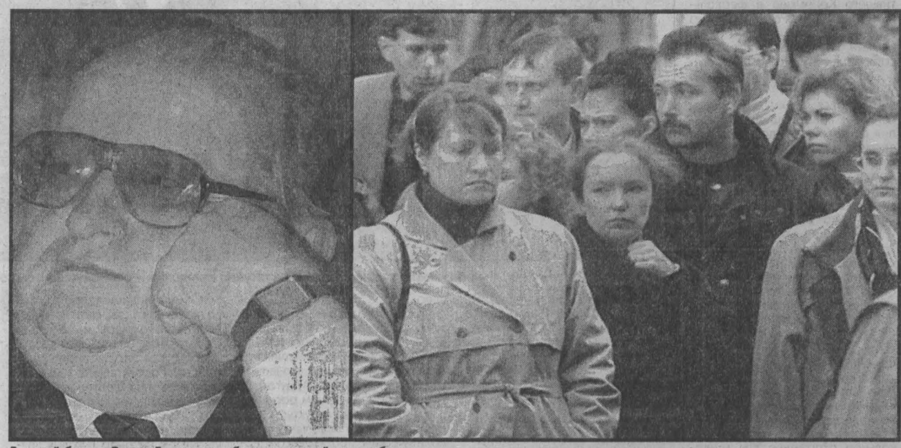
Главный банкир России Герашенко обещает твердый курс рублю.

В окне мы увидим бочку на 159 литров (баррель называется) и приплюсанный к ней центик - 30 долларов. Вот и вся загадка сегодняшних успехов российской экономики.