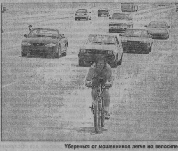
Уберечься от мошенников легче на велосипеде.

На днях прочитал, что по Москве разезжают автожулики: высмотрев жертву, подставляют бок своей машины и требуют возмещения за аварию. Не хотел бы расстраивать соотечественников, но подобная жульничества в США поставило на более солидную основу. Потому что «кретиры» требуют возмещения не ремонта автомобиля, а собственного лечения. А это другие деньги!