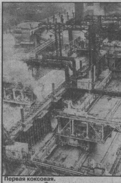
Первая коксовая.

«Даешь второе рождение первой коксовой батареи!» — под таким романтичным лозунгом первых запсибских строков на Западно-Сибирском металлургии в начале 90-х годов в комбинате началась кладка первой коксовой батареи. Она была давно оставлена и ждала начала реконструкции.