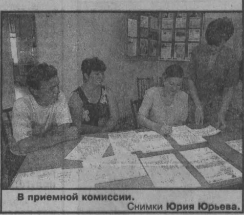
В приемной комиссии.