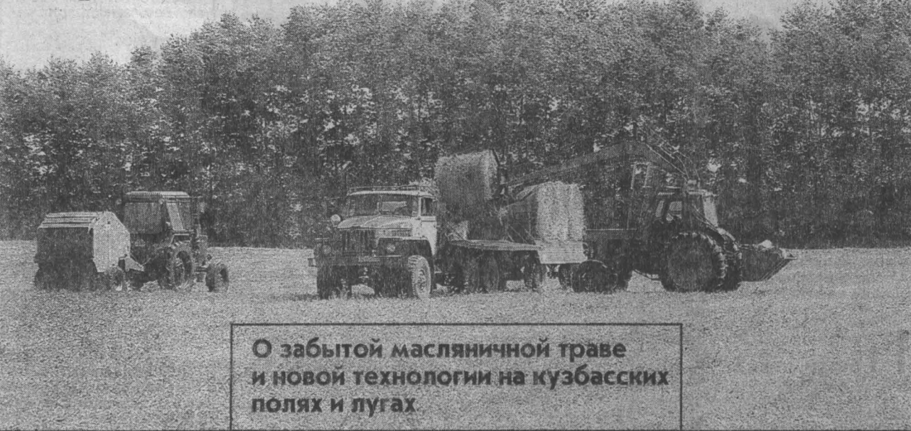
О забытой масляничной траве и новой технологии на кузбасских полях и лугах

И вот второй, похожий на чумайский сенозаготовительный агрегат включили в днях в работу на государственном предприятии «Госплемзавод «Октябрьский». Он выпущен немецкой фирмой «KRONE» и передан администрацией области в надежные хозяйские руки — госплемзаводу, где 800 породистых коров и большой шлейф молодняка.