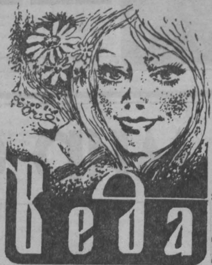
Рис. Валерия Миндеева.

Разговоры наши мыслятся о вещах, событиях и явлениях жизни, непосредственно влияющих на наше с вами здоровье. Например, какое действие на организм оказывают так модные сегодня механические приборы и приспособления, биологически активные добавки к пище. Что такое здоровый образ жизни? С этими и другими вопросами вам помогут разобраться специалисты. Но мы готовы выслушать и тебя, дорогой читатель. Твой совет, отклик, а может быть, и житейский опыт. Так что пиши письма, заказывая тему. Сегодняшний наш первый выпуск рубрики «Веда» — о воде. Человек не может жить без воды. Мы умываемся, выпиваем чашечку кофе на завтрак, готовим пищу, стираем, да мало ли что — все это вещи очевидные, к которым привык и практически не замечаешь. Но однажды вдруг задумаешься... Недавно в одном из городов Кузбасса произошло крупное ЧП: употребив грязную воду, люди заразились дизентерией. Так какая же она, вода, которую мы пьем, коей умываемся?