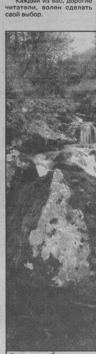
Чистые реки берут начало в горах.

Каждый из вас, дорогие читатели, должен сделать свой выбор.