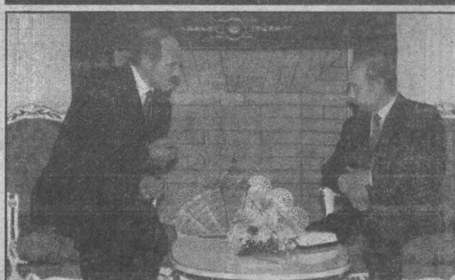
об этом говорят