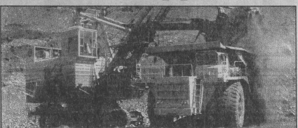
Крупномасштабная добыча метана в Кузнецком бассейне может иметь исключительное значение, так как позволит осуществлять подпитку перспективных экспортных газопроводов в регионы Азиатско-Тихоокеанского региона. Исключительное значение имеет и снижение газоопасности последующей добычи угля, улучшение экологической обстановки и создание рабочих мест на газовых промыслах.

Тяжелое положение в горно-рудной промышленности. На территории Кемеровской области — пять металлургических заводов, один ферросплавный и более десятка машино-