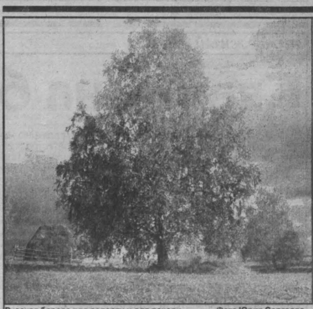
Русская береза для радости и для печали.

По югу области в среду малооблачно, днем до 27, ночью до 13, в четверг ясно, днем до 26, ночью до 16 градусов.