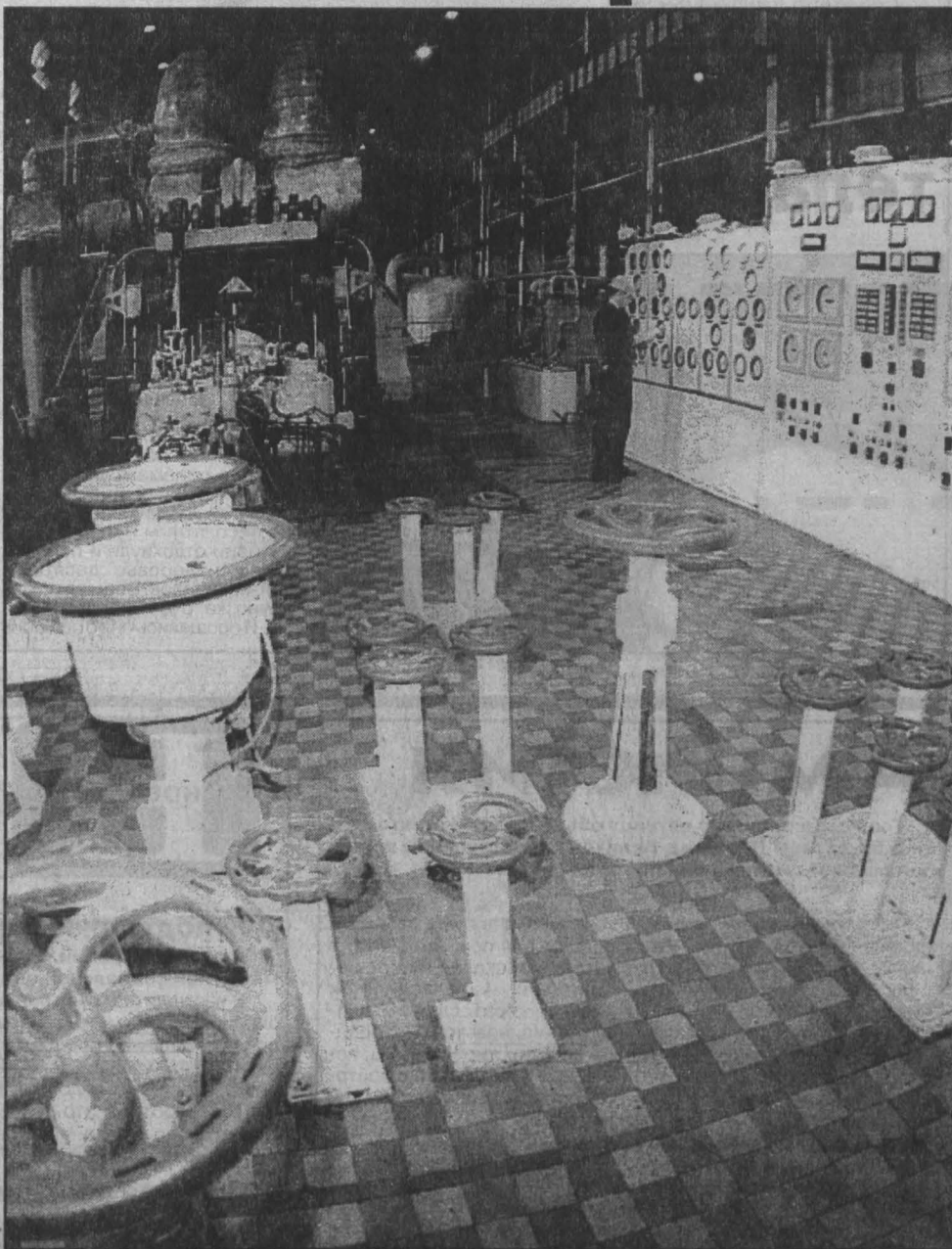
Турбинный зал Южно-Кузбасской ГРЭС ОАО «Кузбассэнерго». Это станция высокой экономичности и культуры производства.