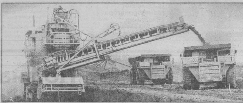
На Еруновском месторождении.

Старые горные инженеры с горстью говорили: «Крестыня добывает хлеб, горняки все остальное». А потому выходы из сегодняшнего экономического кризиса в промышленности, очевидно, необходимо искать именно через горнодобывающие отрасли.