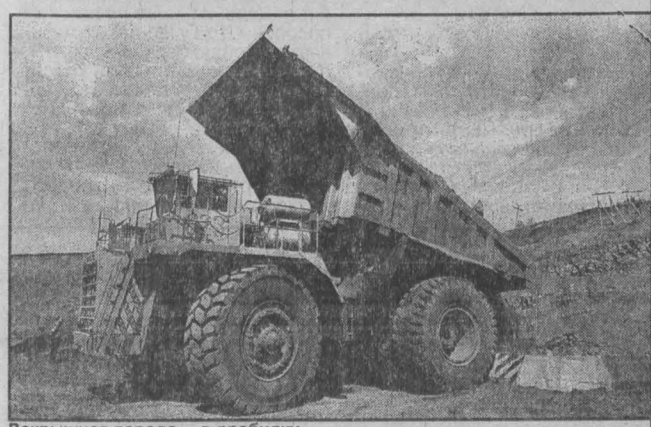
Вскрышия порода — в дробилку.