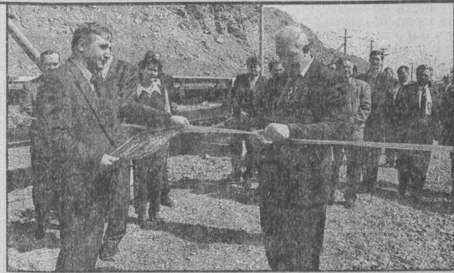
Без красной ленточки не включится главная лента.

(Окончание на 2-й стр.)