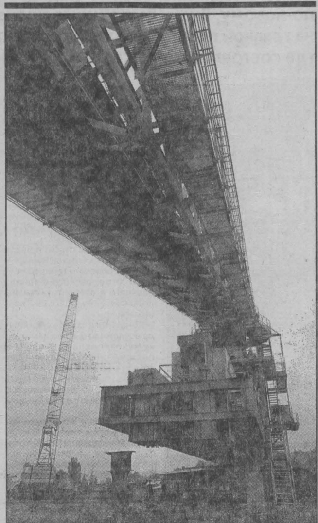
ОАО «Разрез «Бачатский» холдинговой компании «Кузбассразрезуголь» сооружает пятикилометровую конвейерную линию, с вводом которой в эксплуатацию отпадет необходимость вывозить скальный грунт (породу) на автополюк к отвалам. Экономия очевидна. Магистральная конвейер — это, пожалуй, первое крупное сооружение на разрезе.