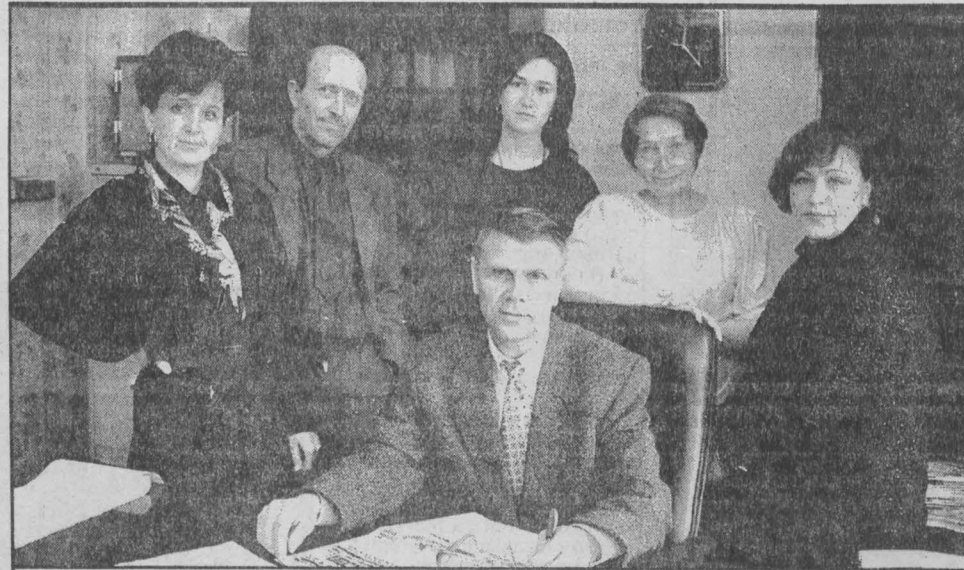
Журналисты «Беловского вестника» довольны своей работой тогда, когда свежий номер газеты не залеживается в торговых киосках Белова, и сами регулярно, два раза в месяц, получают зарплату.

Продолжается прием, обмен билетов, разрабатывается более конкретная работа.