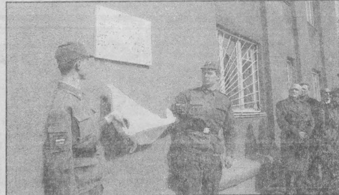
Открытие мемориальной доски чернобыльцам.