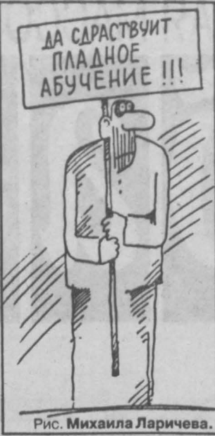
Рис. Михаила Ларичева.

По-видимому, рассмотрение заявления г-на Фролова в арбитражном суде 17 февраля станет очередным актом идиллического спектакля под названием «страсти по власти».