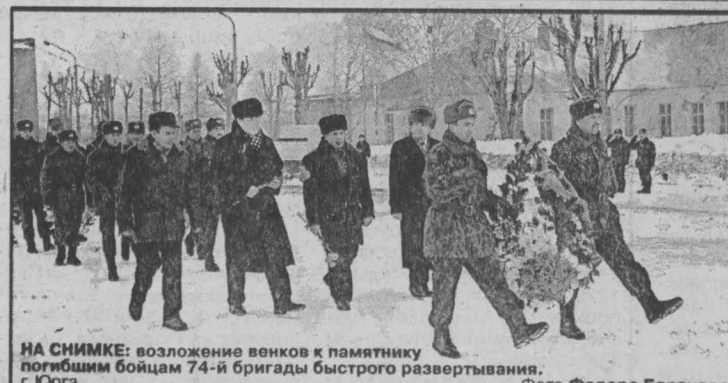
НА СНИМКЕ: возложение венков к памятнику погибшим бойцам 74-й бригады быстрого развертывания.

В воскресенье в городах и районах Кузбасса прошли мероприятия, посвященные десятой годовщине вывода советских войск из Афганистана.