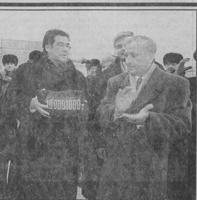
Губернатор поздравляет шахтеров

Суббота, 11 декабря. Шахта им. Кирова ОАО «Кузбассуголь». Скопиче автомобилей у шахтоуправления. Сегодня сюда прибыло немало известных всему Кузбассу людей, чтобы поздравить горняков области с успехом — добычей 100-миллионной с начала года тонны угля. Такого количества топлива Кузбасс не добывал с 1993 года.