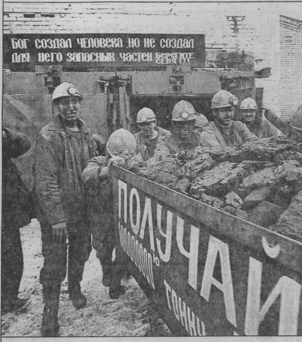
Бог создал человека но не создал для него запасных частей

«Это подвиг» — сказал, поздравляя горняков, губернатор.