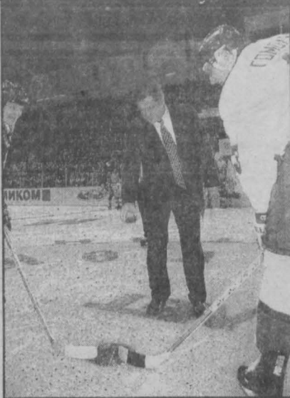
Шайбу в игру символически бросает губернатор А.Г. Тулеев.

На въезде в Новокузнецк большой плакат пригласил болельщиков во дворец спорта кузнецких металлургов. Матч «звезд» «Восток» — «Запад», посвященный 50-летию новокузнецкого хоккея. Такого матча еще не было ни разу: ни в советском хоккее, ни в российском. Счастливая карта первооткрывателей выпала Новокузнецку. Заслуга в том, что Кузбассу было предоставлено право провести первый подобный матч, принадлежат губернатору А.Г. Тулееву. Немало сил вложено в это дело оргкомитетом под руководством мэра Новокузнецка С.Д. Мартина