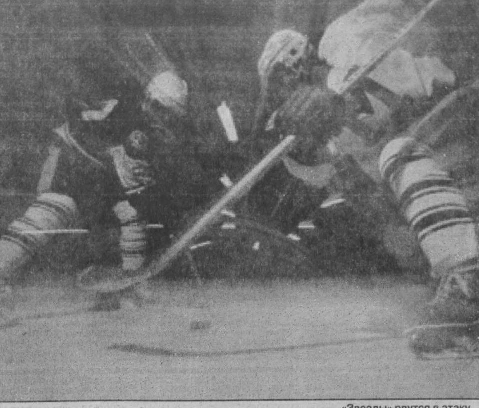
«Звезды» рвутся в атаку.