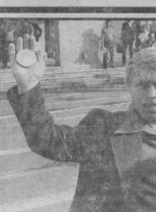
Сегодня в 13 час. 30 мин. в помещении Кемеровского государственного цирка состоится торжественное открытие VII Всероссийского турнира по тяжелой атлетике памяти олимпийского чемпиона, заслуженного мастера спорта СССР Александра ВОРОНИНА.

Завтра в Прокопьевске после реконструкции откроется Дворец спорта «Снежинка». Открытие комплекса начнется матчем по хоккею с шайбой между командами «Шахтер» (Прокопьевск) и «Металлург-2» (Новокузнецк).