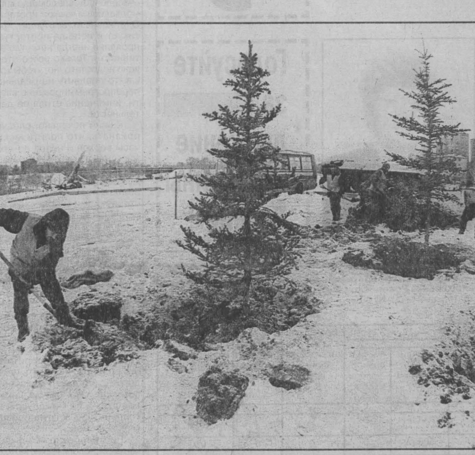
Вчера в парке Победы высажены голубые ели.

Ель — дерево загадочное, особенно голубая. Это остальные породы могут быть «просто» рябиной или яблоней... Голубая ель даже звучит торжественно и красиво. Словом, «благодарное» дерево. Именно такие деревья отныне украшают кемеровский парк Победы, что на берегу реки Искитимки. Здесь возводятся постамент для памятника маршалу Г. К. Жукову. А работники «Зеленстрой» решили украсить площадку вокруг памятника легендарному полководцу этими величавыми красавицами с густой, пышной кроной. В уютном зеленом парке, где уже растут и рябина, и тополя, и ранеты, как раз на хвосте только этих гордых цариц леса. Почему высаживают их так поздно, зимой? Оказывается, время самое подходящее. Часто бывает, что пересаженные взрослые деревья не приживаются на новом месте. Поэтому с елью поступают по-особому. Перед дорогой (а везут ее из Новокузнецка) дерево выкапывают вместе с комом замороженной почвы и тщательно упаковывают этими величавыми красавицами с густой, пышной кроной. В уютном зеленом парке, где уже растут и рябина, и тополя, и ранеты, как раз на хвосте только этих гордых цариц леса. Парк, конечно, не единственное место, где работают озеленители. Высаживают они деревья и в сквере имени Боброва, и во многих других местах. А значит, перед взорами горожан предстанут не только страшные обрубки тополей, но и новые пушистые деревья, что радуют зеленью и зимой, и летом.