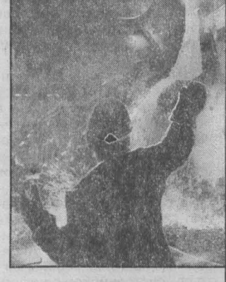
В Новокузнецке прошло совещание по вопросам кооперации Западно-Сибирского металлургического комбината и КМК.