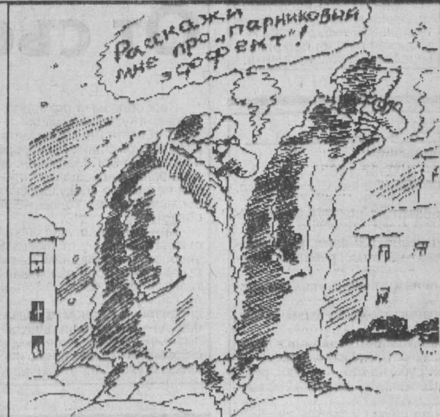
Рисунок Виктора Богорада.

Медаль при помощи ушка и кольца соединяется с прямоугольной колодкой с тремя продольными полосами — белой, синей, красной — шириной 4 мм каждая.