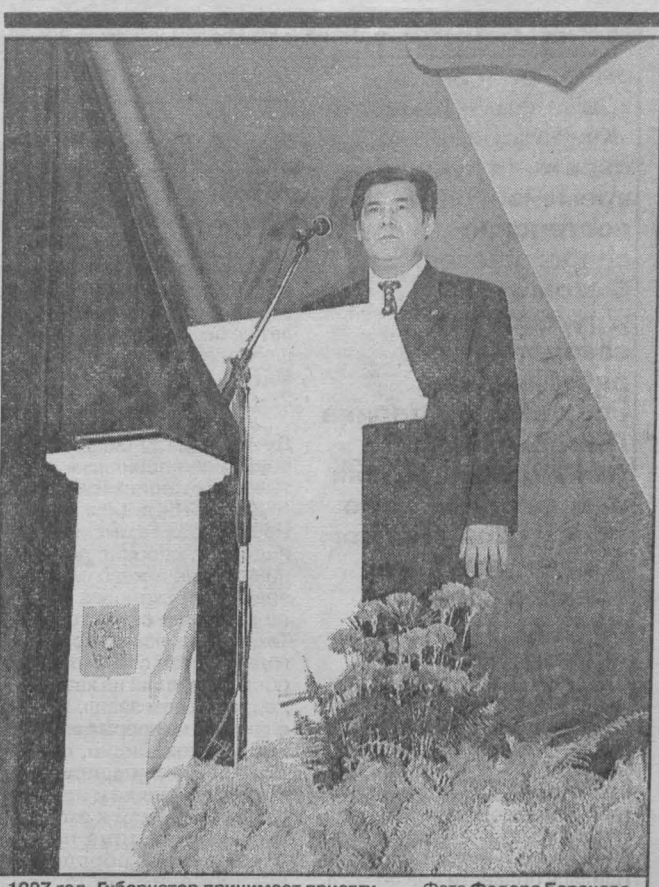
1997 год. Губернатор принимает присягу.