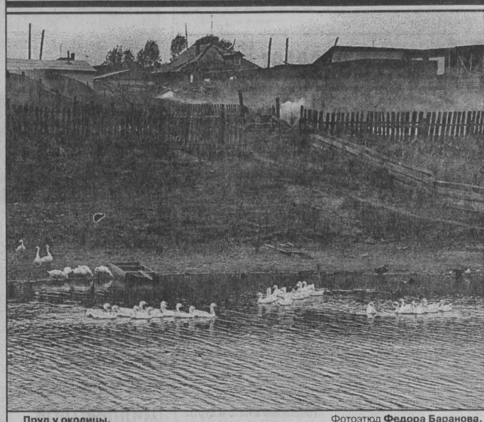
Пруд у околлицы.