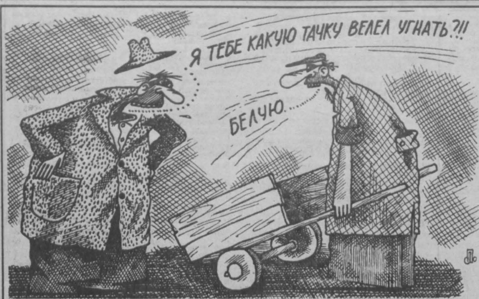
Рис. Михаила Ларичева.