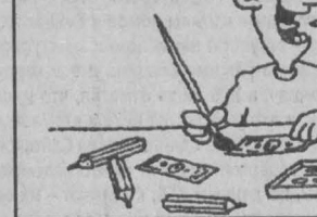
Рис. Игоря Кийко.

Привычка нохать кокаин в Великобритании распространяется все шире. Цена на него упала, и на кокаин перешли те, кто до сих пор бавался лишь «легкими» наркотиками. Его полюбили подростки, напуганные страшными сюжетами о губительных последствиях употребления «экстази».