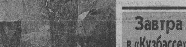
ЖИТЕЛЯМ ДАГЕСТАНА ОТ ШАХТЕРОВ И ЖЕЛЕЗНОДОРОЖНИКОВ КУЗБАССА

Как сообщил областной комитет Госкомстата РФ, в Кузбассе средняя зарплата в августе составила 1788 руб- лей, что на пять рублей боль- ше, чем в прошлом месяце. Разрыв между максималь- ным размером оплаты труда (4162 рубля в банковской сфере) и минимальным (773 рубля в лесном хозяйстве) — в 5,4 раза. По объемам вып- лат за работниками банков следуют работники предпри- ятий цветной металлургии — 3735 рублей, затем финан- сов, кредита, страхования и пенсионного обеспечения — 3541 рубль, энергетики — 2772 рубля, работники чер- ной металлургии — 2700 рублей, топливной промыш- ленности — 2575 рублей, транспорта — 2219 рублей. До уровня средней зарплаты в промышленности (2257 рублей) почти дотянули ра- ботники управленческого ап- парата (2200). В бюджетной сфере на первом месте ра- ботники здравоохранения, физкультуры и соцработники — 1076 рублей, на втором месте — образования — 990 рублей, на третьем — куль- туры и искусства — 983 рубля. Средняя зарплата сельян — 830 рублей.