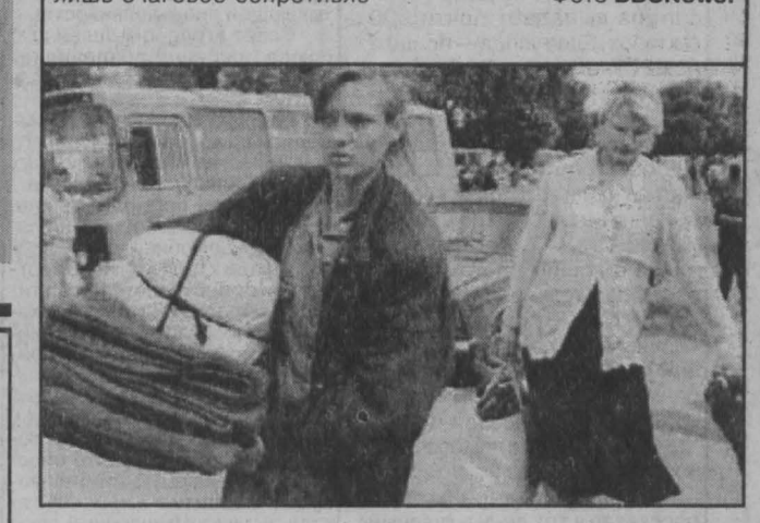
НА СНИМКЕ: эти женщи- ны покатали Грозный три года назад. Сегодня все по- вторяется.

Министр обороны РФ И. Сергеев не исключает: на- ступление продолжится, ар- мия дойдет до Грозного. Гла- ва думского Комитета по бе- зопасности Виктор Илюхин дал в среду пресс-конферен- цию, на которой отметил: сей- час войска дошли до того пре- дела, «за которым начинаются экономические интересы московских финансовых во- ротил и некоторых полити- ков», и очень скоро премьер- министр Путин наткнется на серьезное сопротивление. Пока, подчеркнул Илюхин, войска идут по равнине, где нет особой экономической инфраструктуры. И указал: бомбардировки не затронули ни одного объекта, входяще- го в сферу интересов Бориса Березовского. Имя Березовского прозвуч- ало в этот день еще раз — из уст экс-премьера С. Степаши- на. Он сообщил журналистам — Шамиль Басаев получил крупные суммы денег из Мос- квы, и именно от Березовско- го. Якобы на компьютеры. То обстоятельство, что за- нятая войсками северная часть Чечни — это равнина, а южная — это в основном горы, осложняет продолжение кам- пании и чисто технически. Если сейчас Российская ар- мия встречает на своем пути лишь очаговое сопротивле-